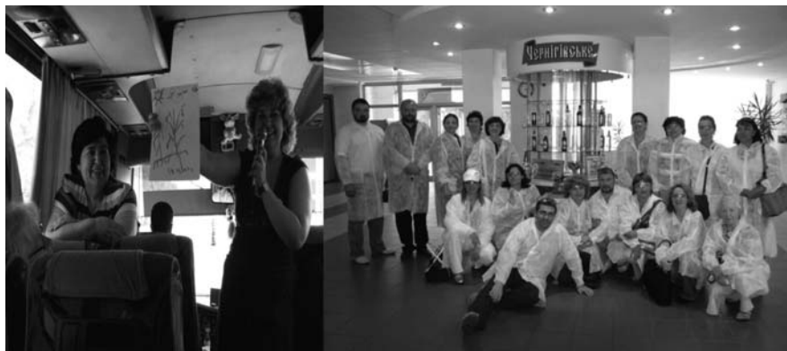
Учасники туру під час початку тренінгової сесії з екологічно чутливого стилю життя та ознайомчого візиту до заводу компанії САН ІнБев, Україна у м.Чернігів.