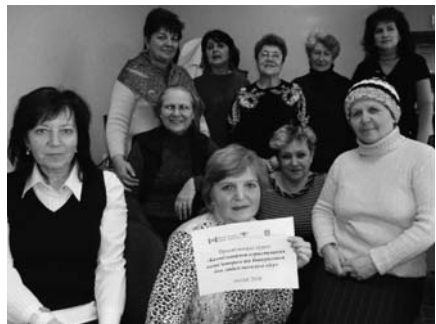
Учасники просвітницького курсу з нових медіа, м. Київ та комп'ютерного курсу у м. Бровари, 2010