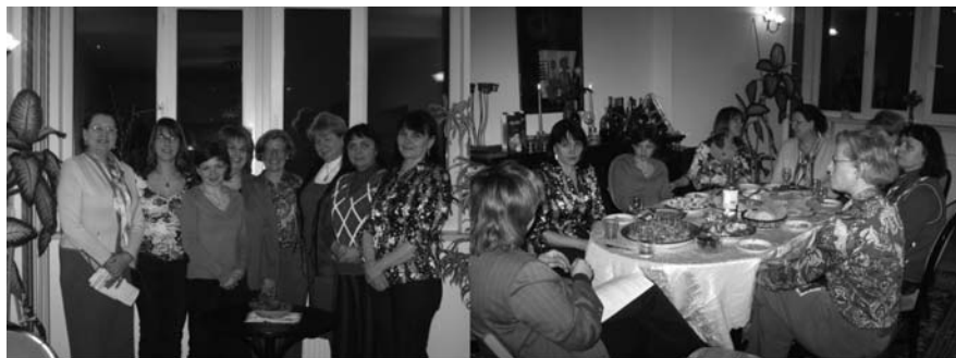
Фотографії зроблені під час неформальних зборів, березень 2010