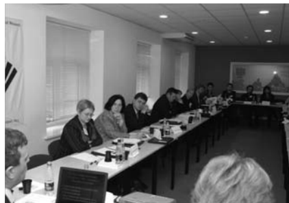
Робочі моменти під час експертного круглого столу з КСВ у грудні 2006