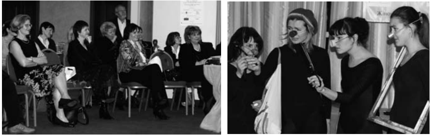
Учасники святкування 10-ї річниці Ліги, Київ, 2007

професійною мережею при Британській раді, «Театром на Грушках») і працюючими в Україні бізнес-компаніями (які надали матеріальну, фінансову, волонтерську допомогу). Це: The Leading Hotels of the World, САН ІнБев Україна, AVON, готель Опера, Міжнародна консалтингова компанія.