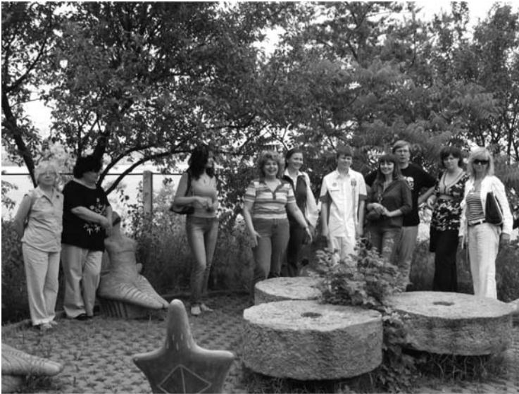
Фотографія зроблена під час літньої зустрічі 2008 р. біля приватного музею у селі Трипілья, Київської області

Окремо слід відзначити наші літні зустрічі та Річні збори , які також завжди мають культурне та просвітницьке забарвлення. Річні збори членів мережі кожного року мають різну основну ідею та проводяться у іншому місті, що надає можливість розвивати ділові контакти. Так, наприклад, шості річні збори пройшли у форматі фієсти, дев'яті – музичного салону, десяті – театральної вистави, одинадцяті – у музеї старовинної книги, а дванадцяті – відзначили поїздкою «Зелений креативний тур».